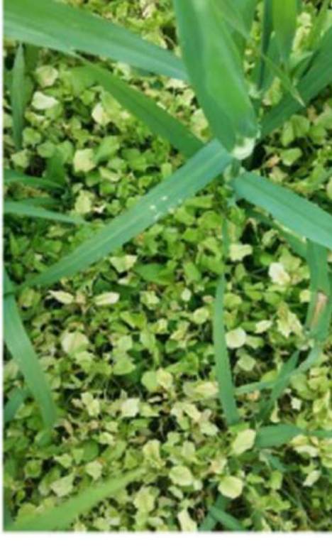
7 päeva pärast pritsimist