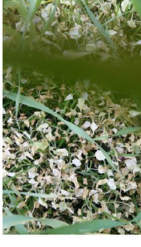
21 päeva pärast pritsimist